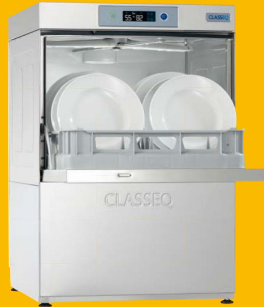
D500 RBP mit Drucksteigerungspumpe Bestellnummer 809V0020