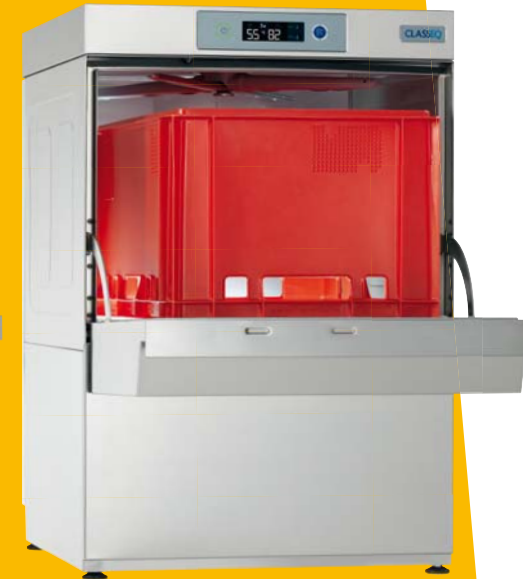
D500 RBPDD mit Drucksteigerungspumpe und tiefer Türe Bestellnummer 809V0029